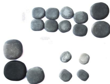
Ergänzungs - Set

Kostengünstig bieten wir die Kombination Basis + Ergänzungs-Set als PROFI-SET an! Gesamt 51 Steine bester Qualität für den professionellen Massagebetrieb.