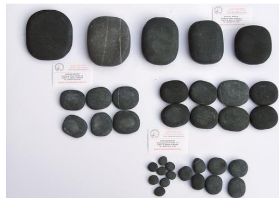
Basis - Set